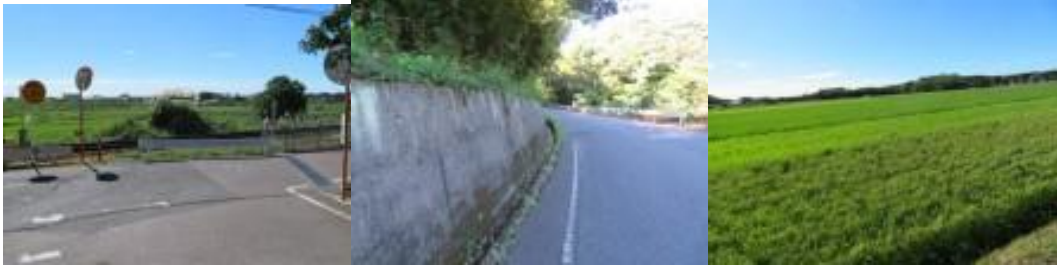
※石見津田駅への路（国道9号線は遠回りと察知して）