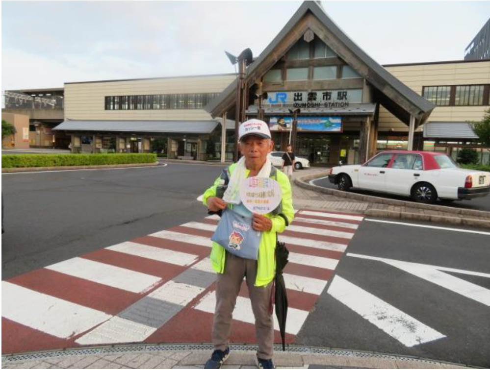
※2022年8月5日（金）出雲市駅