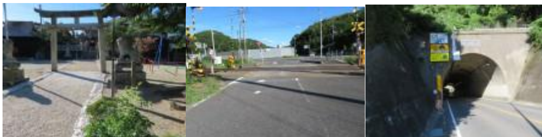
※水雲嶋八幡宮、津田東踏切、津田トンネル

45分待ち時間があったので、冷たい飲料水を求めて自動販売機を探すが、見当たらず。5分戻った先で自動販売機をやっと見つけ、喉を潤すことができる。