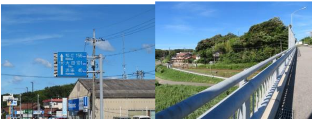
※浜田まで40 km地点、遠くにJR線が見える

15時15分、浜田40 km、大田101 km、松江166 kmと記した道路標識前を通過。鉄道が左側にあると思い、国道9号線から離れた道筋を進む。15時27分、今市川を渡る。突き当たりを右折し、暫く歩くとJR線が見えて来る。右手にあったので驚く。恐らくどこかで線路を跨いだのであろう。15時32分、JR線を跨いだ先で、15時36分、鉄道の直ぐ右側となり、暫くこのポジションをキープして歩く。しかし、いつの間にかJR線は森の中に消えてゆく。16時2分、石見交通久城団地バス停前を通過。16時33分、津田西踏切を横切ろうとするが、取り止める。しかし、鉄道の右側を歩くが、駅への行ける道筋がない。運よく地元の人と聞く機会を得る。「この細い路筋からJR線を潜ることができます」と教えて頂く。石見津田駅には16時40分到着する。