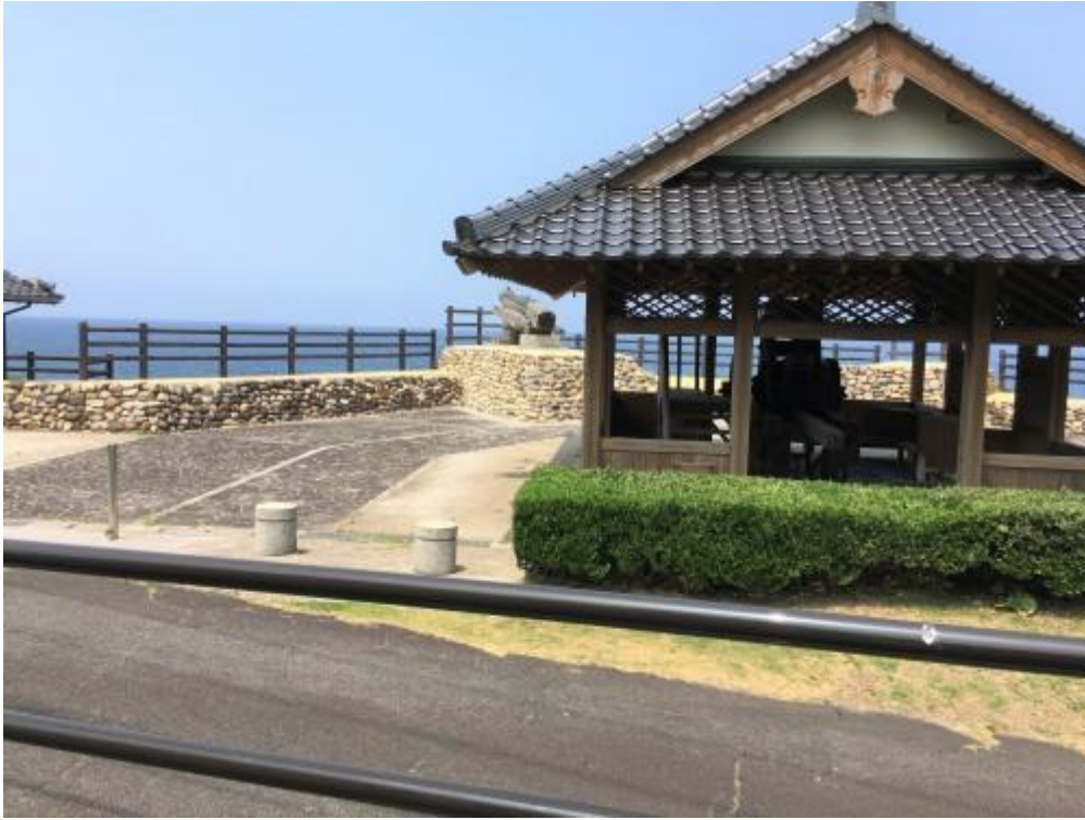
※手引ヶ浦台場公園