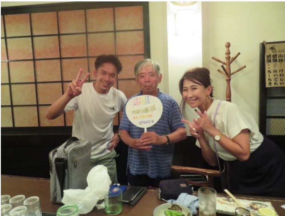
居酒屋”たちばな”で札幌から来たカップルに祝って頂く！！