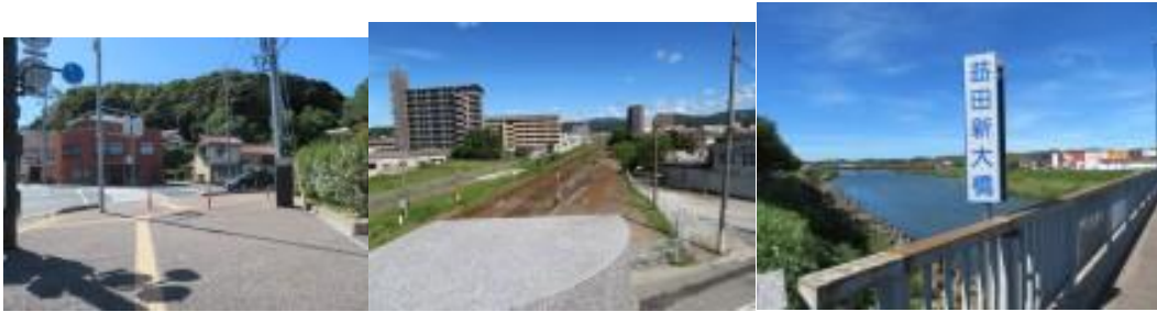
※まもなく歩くと国道9号線、跨線橋を渡る、益田新大橋