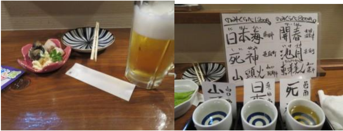
呑み比べ（山頭火：防府市、日本海：浜田市、死神：邑南町）を堪能する